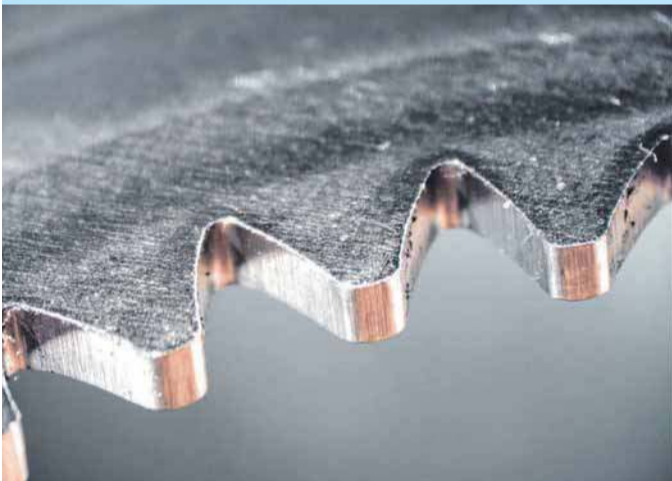
Hier dreht sich alles rund um die Feinschneidetechnik.

Wie bereits schon erwähnt, mache ich mir um die Gesellschaft WEBO auch für die nächsten zehn Jahre keine Sorgen. Der hohe Innovationsgrad in Verbindung mit modernsten Fertigungstechnologien sowie weiteren Patentanmeldungen in unterschiedlichen Marktsegmenten wird WEBO auch in den nächsten Jahren als attraktiven Arbeitgeber und Problemlöser am Markt erfolgreich machen.