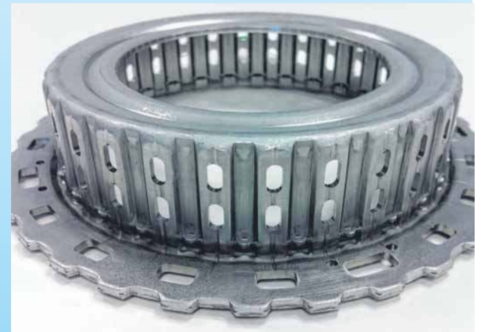
Ein Fachgebiet ist die Herstellung von Prototypen.