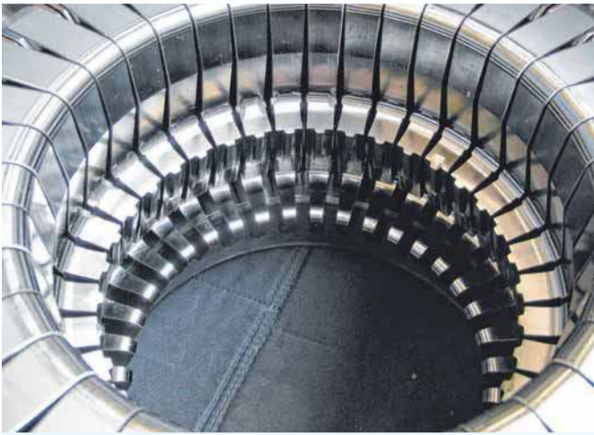
WEBO Werkzeugbau ist Spezialist in der Präzisionsfertigung.