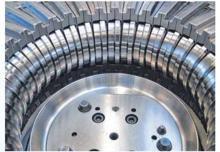
WEBO steht für klassische Rollwerkzeuge.