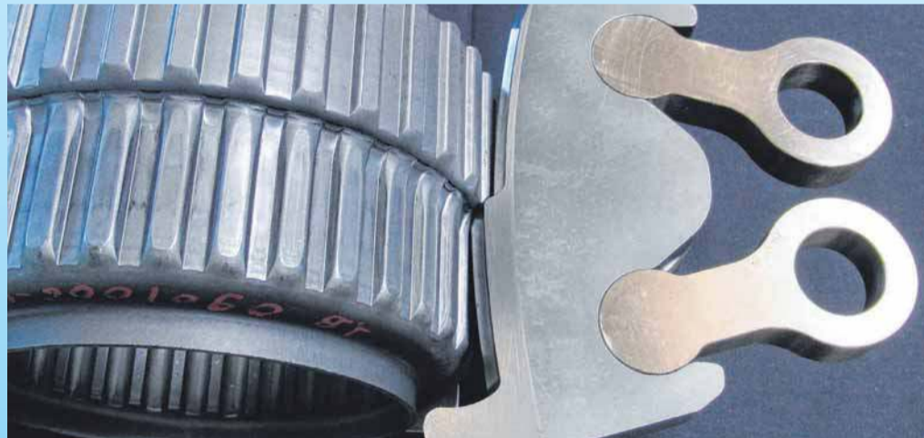
Das Pleueiformen von WEBO ermöglicht gänzlich neue Bauteilgeometrien.